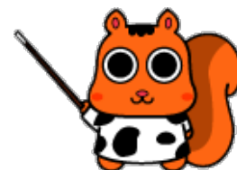
モーリスのモコちゃん

3) [受付完了メール]に記載されている「振込口座」に、受講料をお振込み いただいたら申込完了です